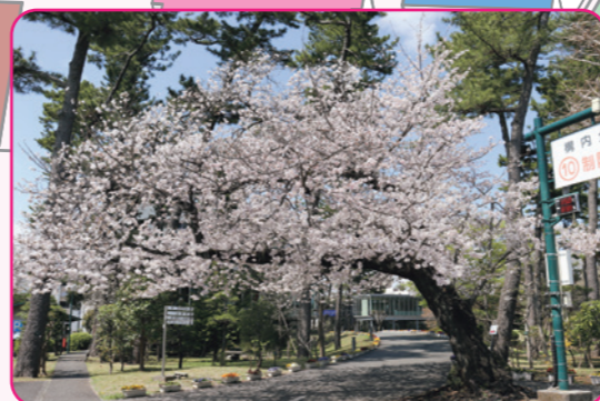
夢をかなえるセンター マーガレットホール