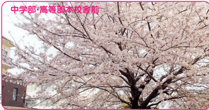
中学部・高等部本校舎前