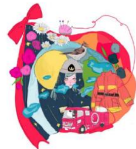
学生が作成したイラスト