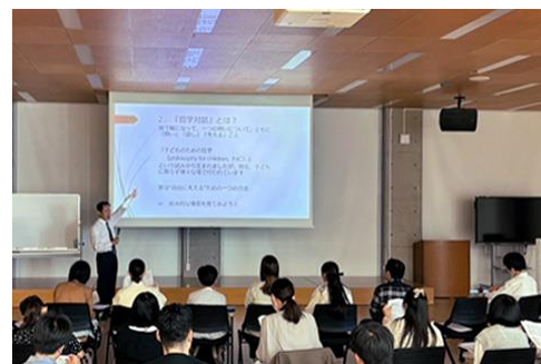
毎年4回、秋学期の土曜日に行われる 「大学で学ぶ楽しみ発見セミナー」の様子

日本では、大学での障害学生在籍率は1.62%（2024年）（※）であり、障害のある若者が大学への進学機会を得られていません。こうした中、相模女子大学では、文部科学省事業を受託している相模原市から再委託を受け、障害のある若者が「学び続ける場」をつくるプログラム「インクルーシブ生涯学習プログラム」の開発事業を、2021年度から実施しています。