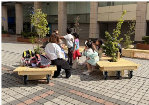
優秀賞を受賞し、横浜駅東口「はまテラス」で展示された新作ベンチ