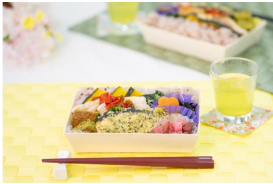
弁当「こだわり素材の『おいしい宝箱』」