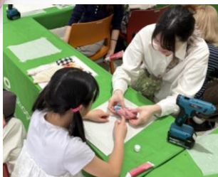
2026年4月にポーノ相模大野 で開催したワークショップの様子 →