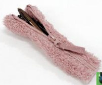
←アップサイクル作品の例 (ベンケース)