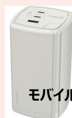
モバイルバッテリー

※使用後は、ICTサポートデスクに返却してください。窓口時間外の返却は、返却ロッカーへ