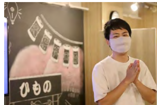
小田原もくもく・ ワーケーション会 (ワークと交流)