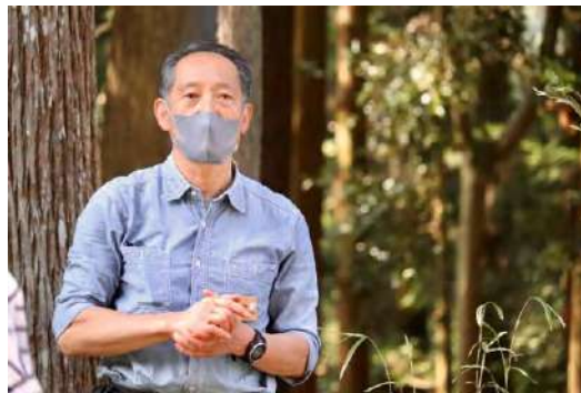
森林インストラクター (森ワーケーション)