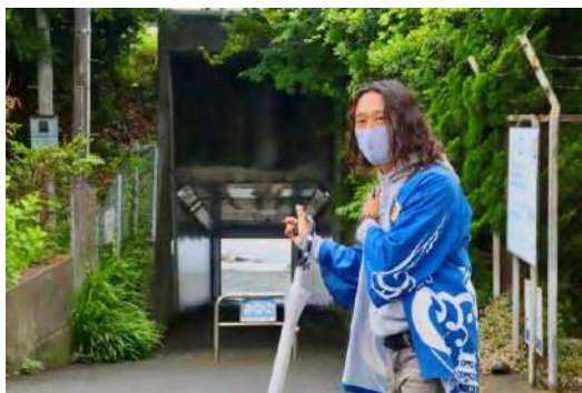
かまぼこ通り 活性化協議会 (街歩き・海鮮食べ放題)