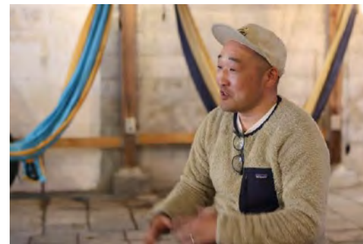
BLEND (国府津) (海ワーケーション・映画イベント)