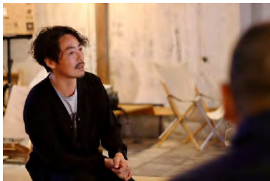
T-FORESTRY (マウンテンバイク体験など)