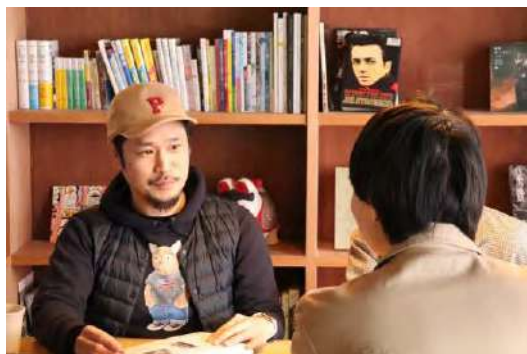
旅館プラム (宿泊、自転車ツアー、 ワークスペース)