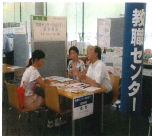
オープンキャンパスでの相談の様子