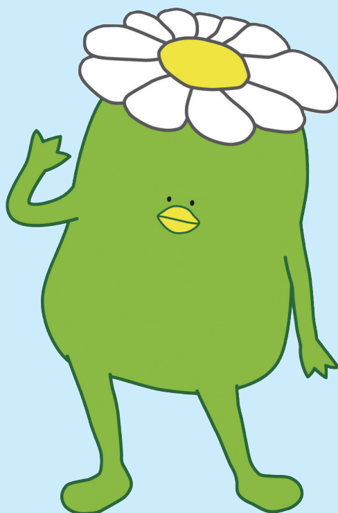
相模女子大学 学園キャラクター