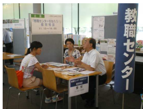
オープンキャンパスでの相談の様子