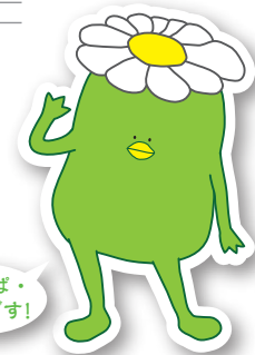
相模女子大学 学園キャラクター

〒252-0383 神奈川県相模原市南区文京 2-1-1 TEL.042-742-1442 FAX.042-742-1441 http://www.sagami-wu.ac.jp/chukou/